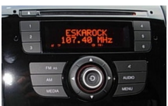
Ducato dal 2010-->