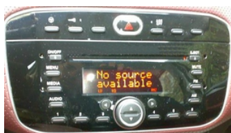
Punto EVO Punto dal 2013-->

DOBLO DUCATO dal 2010-> con radio DELPHI