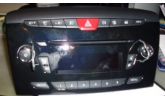
Lancia Ypsilon 2012-->

Kit cavo per collegamento AUX su PUNTO EVO dal 2012 in poi , Punto restyling dal 2013 in poi e FIAT 500 dal 2013 in poi, LANCIA Ypsilon dal 2012 equipaggiate con radio BOSH .