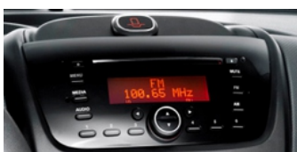
Doblò dal 2010-->